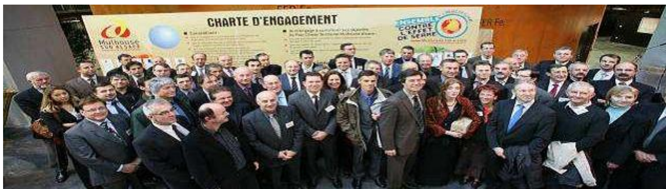
Zdjęcie: Podpisanie Planu Ochrony Klimatu

Rada zapewnia realizację zasad demokracji partycypacyjnej, zachęcając do wymiany opinii pomiędzy zainteresowanymi osobami, zwłaszcza przedstawicielami społeczeństwa, oraz zabiegając o nowych partnerów. Propozycje wychodzące ze strony społeczeństwa są poddawane pod dyskusję, co pomaga w opracowywaniu konkretnych środków redukcji emisji CO 2 . Rada doradcza jest także odpowiedzialna za wdrażanie oraz monitoring i ocenę wdrażania Planu Ochrony Klimatu.